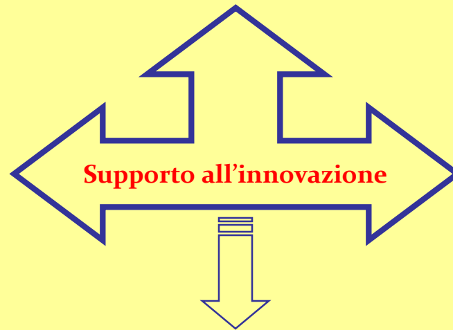
FIGURE INTERNE D' ISTITUTO